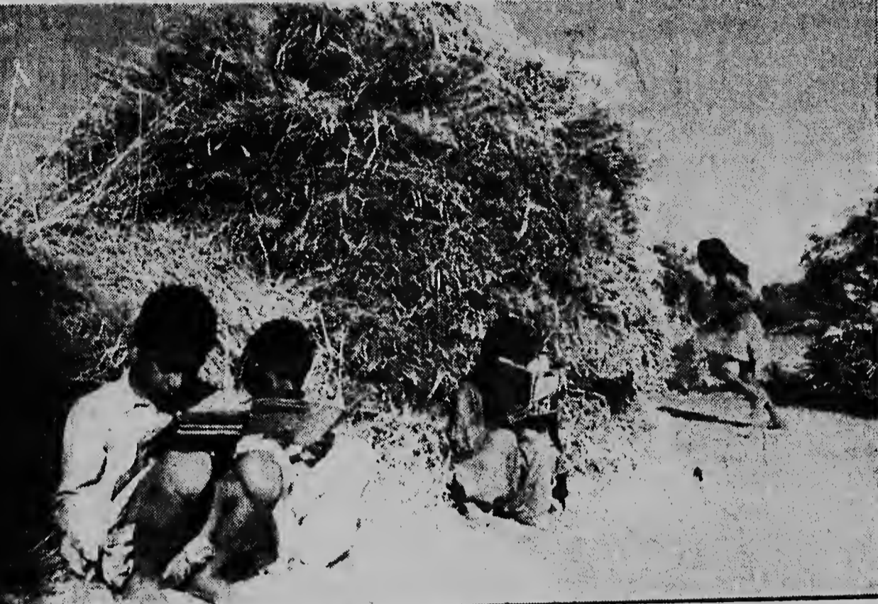
Cu ayuda de Naciones Unidas (Unesco) Libreria Publica di Delhi na 1950 a habri e ocasion pa fiamiento di boeki, cual durante di e prome cinco anjanan a fia un milion di boeki na 30.000 persona cu ta leza regularmente. Si e lectornan no por bai na e bibliotek, anto e bibliotek ta bini serka nan cu bus. Biblioteca similar a wordo habri door di Unesco na Colombia y na Africa. Aki nos ta weita con e pobereito muchanan aki ta probecta un rato liber pa nan leza for di e boekinan cu nan a fia.

Londen, 11 dec. — De „Prawda” heeft gisteren in een artikel geschreven, dat „de dreiging van een nieuw gewapend conflict in het Nabije en Midden-Oosten, uitgelokt door imperialistische krachten in Groot Brittanje, Frankrijk en de Verenigde Staten, ernstige ongerustheid onder alle volkeren van Azië en Afrika heeft teweeggebracht. De Amerikaanse imperialistische krachten hebben hun masker van vredestrichtheid afgelegd door de anti-Syrische campagne officieel goed te keuren. De officiële Amerikaanse steun aan het pact van Bagdad loont, dat er groepen in de Verenigde Staten bestaan, die dit agressieve blok aan hun eigen aggressive doeleinden willen aanpassen”, aldus het blad.